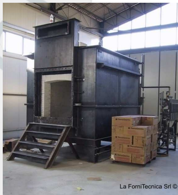
La ForniTecnica Srl ©