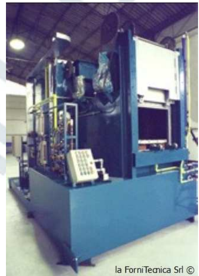
la ForniTecnica Srl ©