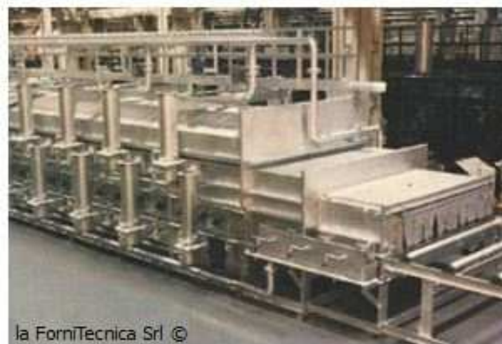
la ForniTecnica Srl ©